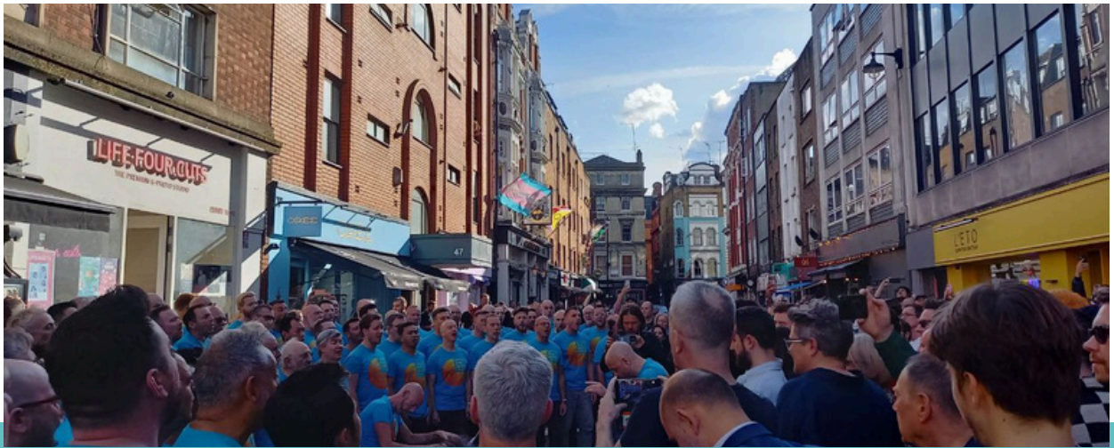
Auf der Straße singt der London Gay Men's Chorus unter anderem „Chosen Family“ von Elton John und Rina Sawayama, eine Hymne für die LSBTIQ*-Szene.

Draußen auf der Straße wird ein Keyboard aufgebaut, rund hundert Männer des London Gay Men's Chorus versammeln sich. Sie singen unter anderem „Chosen Family“, Elton Johns und Rina Sawayamas Hymne für die LSBTIQ*-Szene. Nahezu alle singen mit.