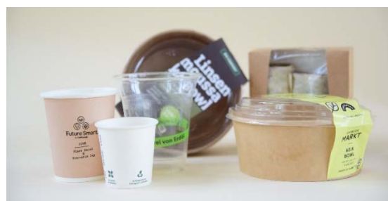
Abbildung 1. Wer Einwegplastik wie beschichtete Papp- oder Bioplastikverpackungen für die Bereitstellung von Essen und Trinken verwendet, muss künftig auch Mehrwegalternativen anbieten.

Dabei ist unerheblich, ob die Behältnisse ganz oder teilweise aus Kunststoff bestehen. Auch wenn nur die Beschichtung Kunststoff enthält, fällt ein Behältnis unter die neuen Regelungen. Irrelevant ist ebenfalls, ob es sich um sogenanntes Bioplastik handelt. 1